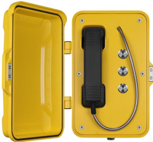
Teléfono resistente a la intemperie

Modelo:101-3B : Están diseñados para ser utilizados por los ferrocarriles, las centrales eléctricas, los servicios armados y la industria pesada que requieren una telefonía muy fiable en condiciones adversas.