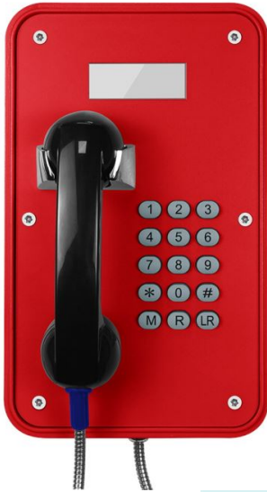
Teléfono resistente a la intemperie